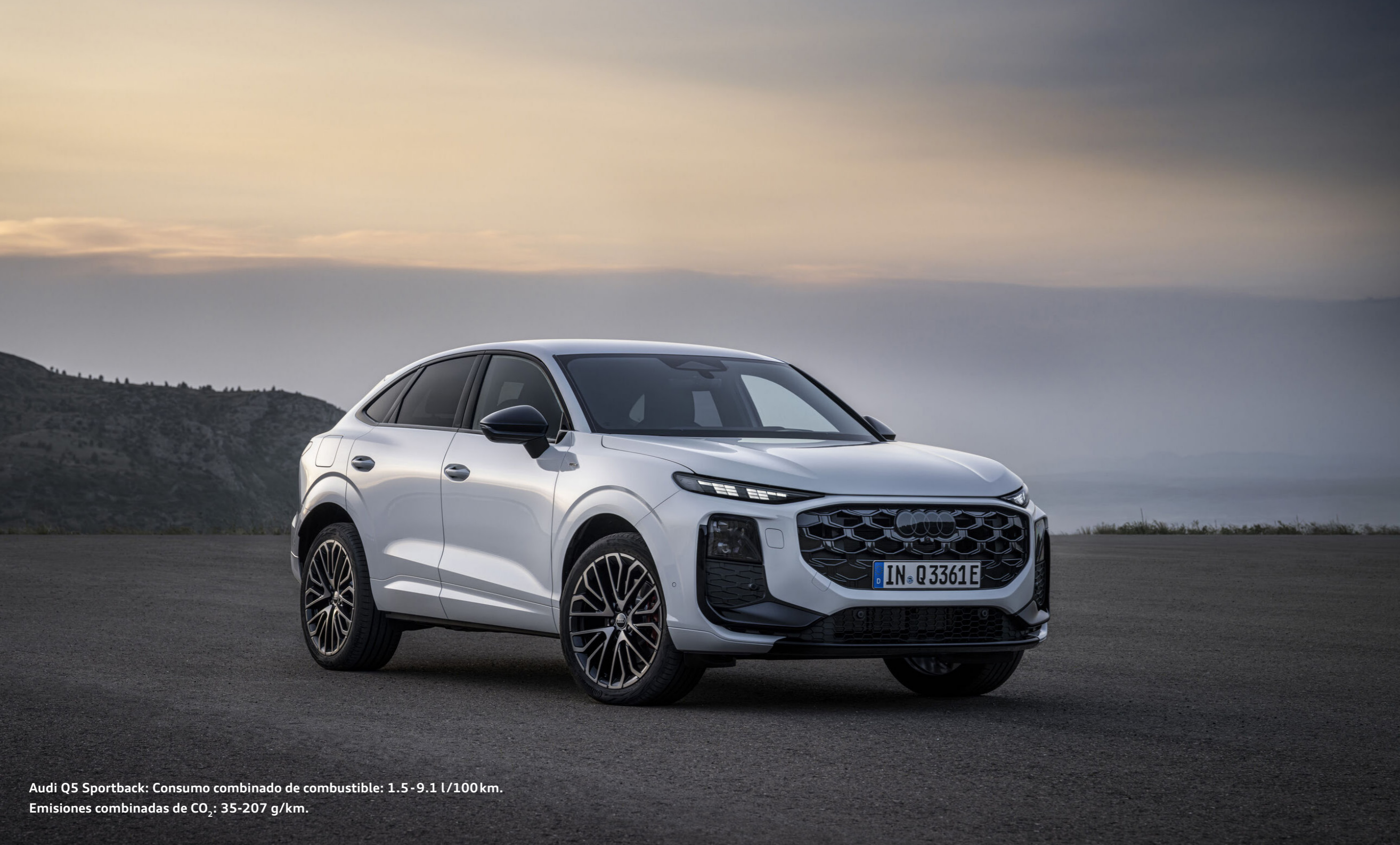
Audi Q5 Sportback: Consumo combinado de combustible: 1.5-9.1 l/100km. Emisiones combinadas de CO 2 : 35-207 g/km.