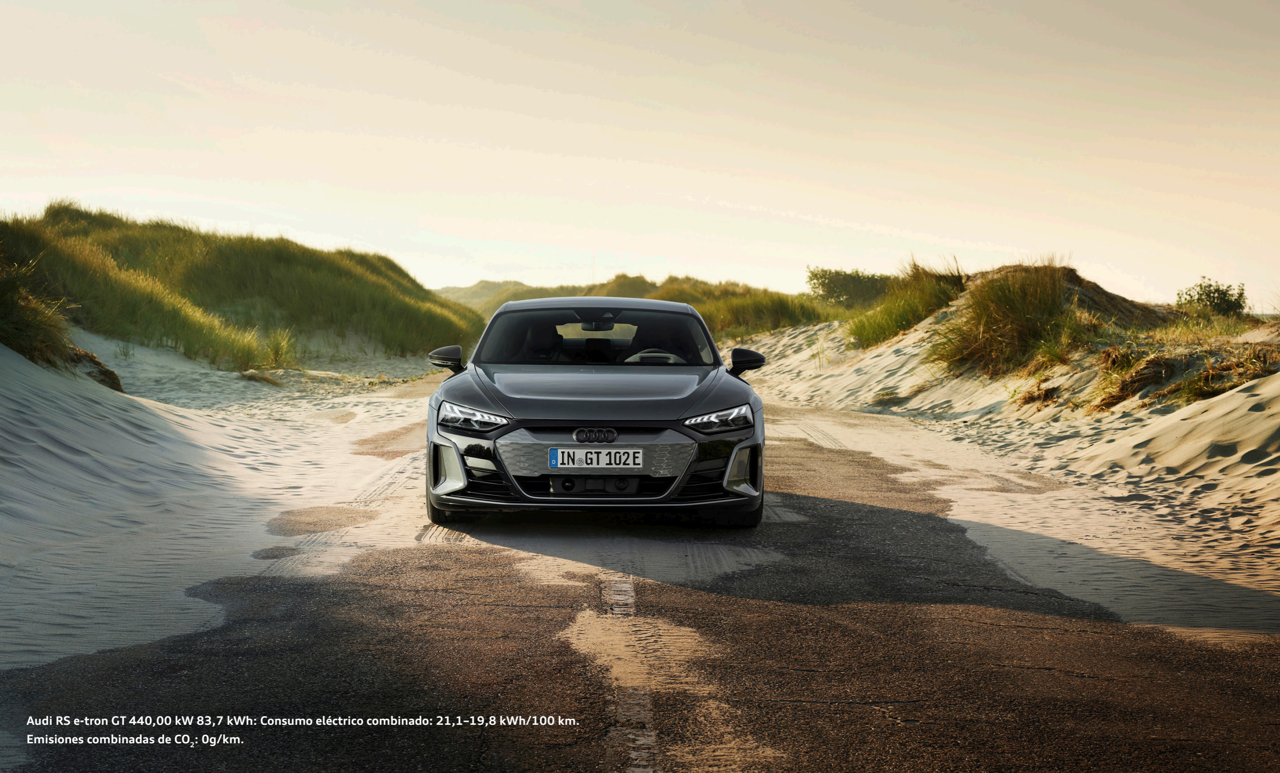
Audi RS e-tron GT 440,00 kW 83,7 kWh: Consumo eléctrico combinado: 21,1-19,8 kWh/100 km. Emisiones combinadas de CO 2 : 0g/km.