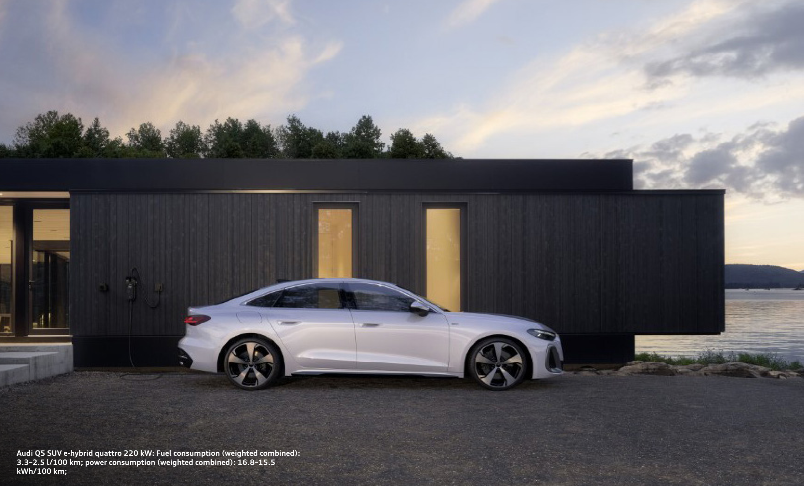
Audi Q5 SUV e-hybrid quattro 220 kW: Fuel consumption (weighted combined): 3.3-2.5 l/100 km; power consumption (weighted combined): 16.8-15.5 kWh/100 km;